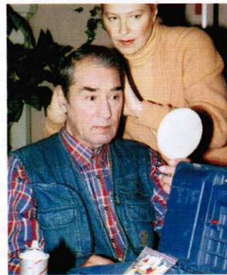
Спартак Мишулин, актер

Если же времени на поездку совсем нет, отдыхаю очень традиционно: слушаю хорошую музыку и читаю хорошие книги.