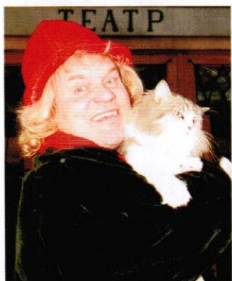
Юрий Куклачев, артист