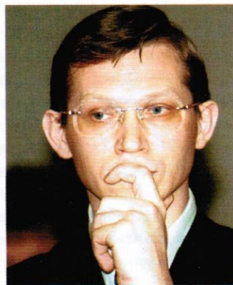
Владимир Рыжков, депутат Госдумы